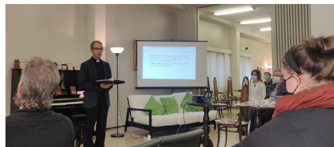
SLEF:s ledningsgrupp besökte oss den här hösten!

Detta år har vi Psaltaren som huvudtema. Vi har fått god undervisning kring vilken bok psaltaren är och hur man kan använda den som t.ex. bönebok. Inbjudna talare är främst predikanter och präster från LFF och SLEF, men även andra goda förkunnare och teologer bjuds in.