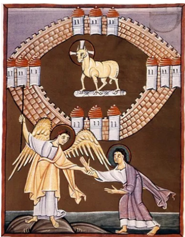
En ängeln visar Johannes Guds Lamm i Nya Jerusalem. Målningen från Turkiet 1000 e.Kr.