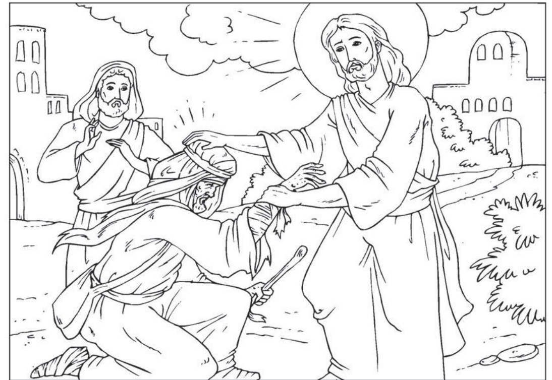
Jesus botar en sjuk man